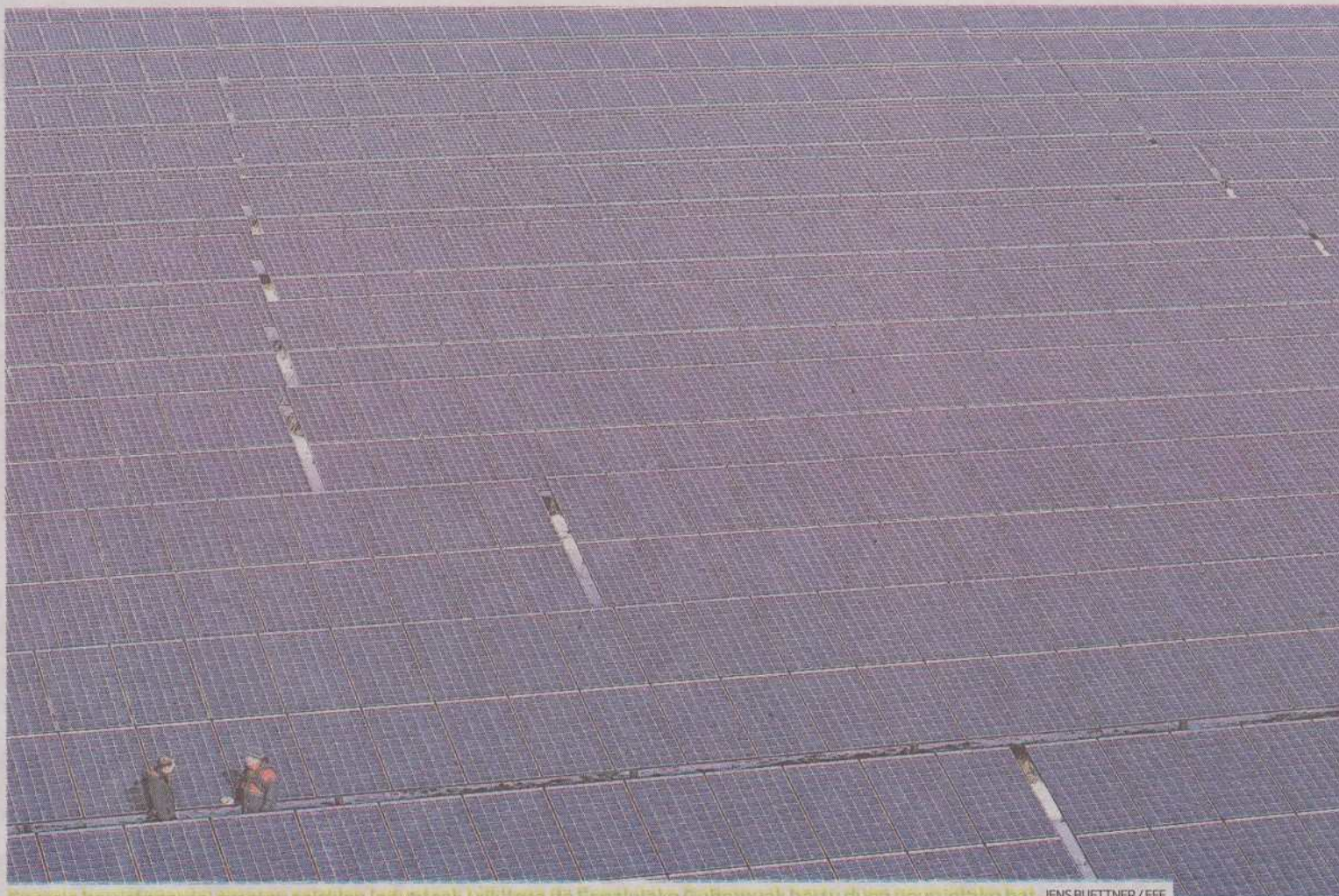
Energia berriztagarriari ematen saizkien laguntzak txikitzea da Espainiako Gobernuak hartu duen neurrietsako bat.

«Gaur egungo ordainsariak goitik behera aldatuko dira, eta arrazoizko errentagarritasuna