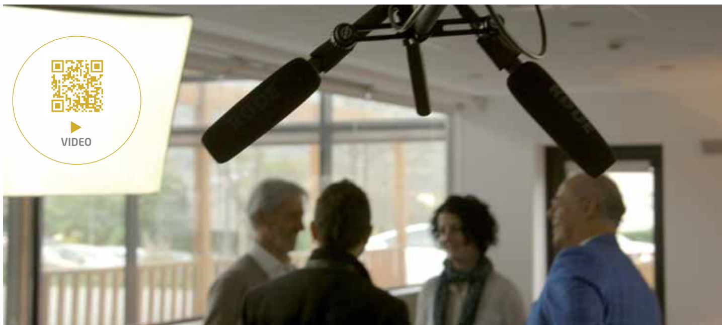
Grabación del debate a dos.

a renovar el contrato. Tienes razón, lo hemos tenido todo y nos parece lo normal.