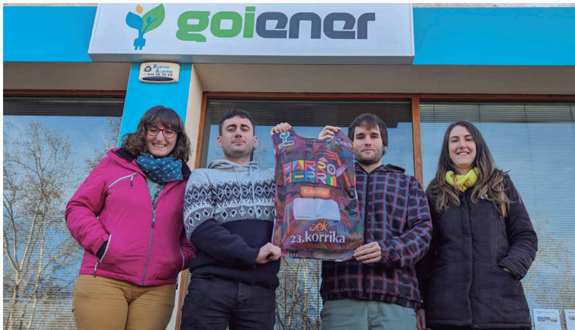
Euskararen aldeko konpromisoa adierazteaz gain, eredu energetikoa "demokratizatzeke eta eraldatzeko" eskatuko dute Korrikan. ALEA